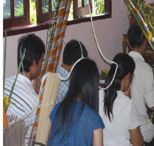
ภาพที่ ๑ พิธีการสืบชะตา

๓. การเลี้ยงผี การเลี้ยงผีมักจะทำในตอนพลบค่ำ (ภาษาล้านนาเรียกว่า สะลุ่มสะลุ่ม) ทำโดยใครก็ได้ แต่ส่วนใหญ่จะให้ผู้เฒ่าผู้แก่ในครอบครัวเป็นผู้กระทำพิธี โดยการเลี้ยงจะนำของเลี้ยงไปเลี้ยงผี ณ บริเวณที่ผีสิงสถิตอยู่ (หมอเมื่อจะเป็นผู้บอก) ทั้งนี้ผีในมิติสุขภาพของประชาชนจะแบ่งได้เป็น